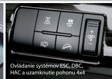
Ovládanie systémov ESC, DBC, HAC a uzamknutie pohonu 4x4