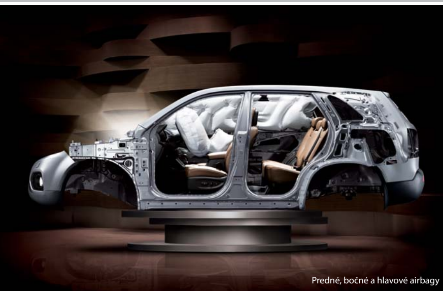
Predné, bočné a hlavové airbagy