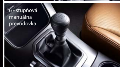
6 - stupňová manuálna prevodovka