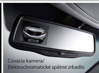
Cúvacia kamera/ Elektrochromatické spätné zrkadlo