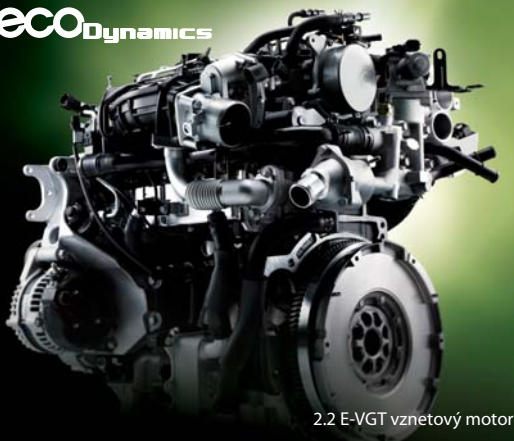
2.2 E-VGT vznetrový motor