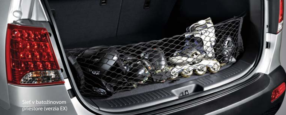
Sieť v batožinovom priestore (verzia EX)