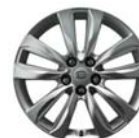
235/60R 18" palcový zliatinový disk