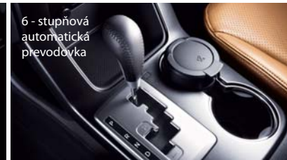
6 - stupňová automatická prevodovka