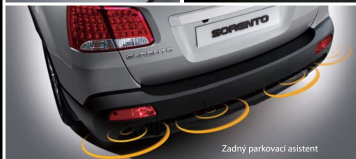
Zadný parkovací asistent