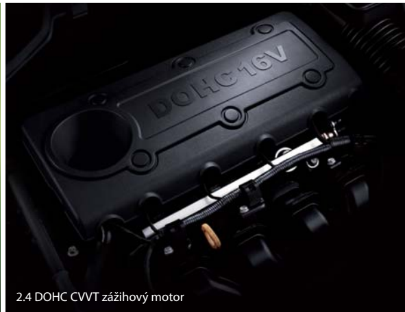
2.4 DOHC CVT zážihový motor