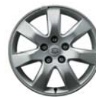
235/65R 17" palcový zliatinový disk