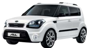
White No. 1*

Kia Soul ponúka jedenásť farieb karosérie (z toho štyri nemetalické *), takže si zaručene vyberiete.