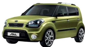
Green Tea Latte